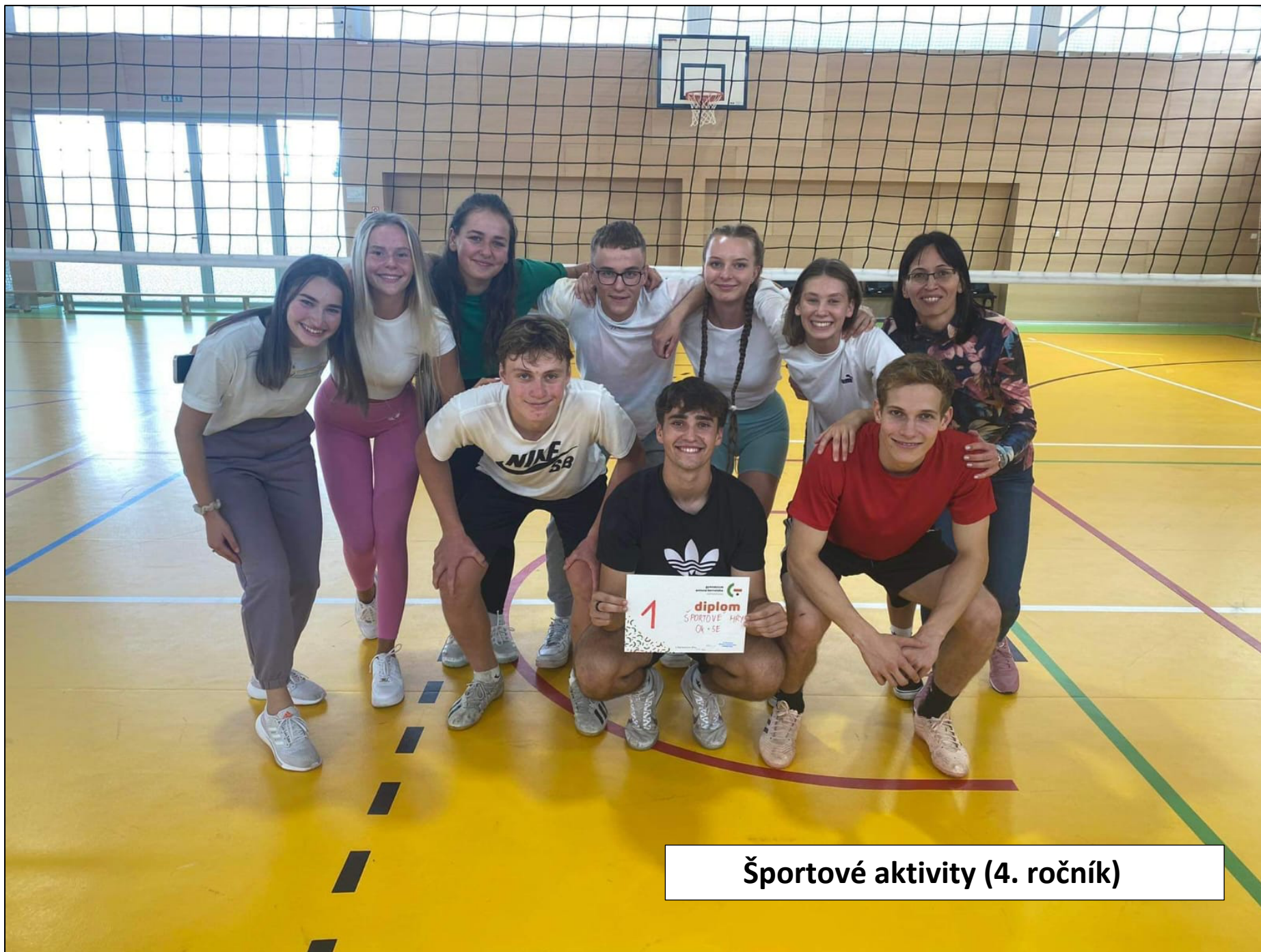
Športové aktivity (4. ročník)